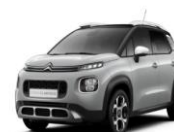
Серебристый металлик COSMIC SILVER (Z5M0)