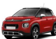
Красный PASSION RED (Z4P0)