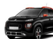
Черный металллик INK BLACK (Z7M0)