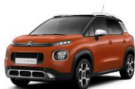
Оранжевый металллик SPICY ORANGE (Z8M0)