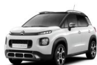
Белый NATURAL WHITE (Z3P0)