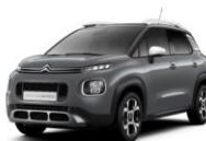
Серый металллик MISTY GREY (Z6M0)