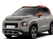
Песочный металлик SABLE