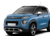
Синий металллик BREATHING BLUE